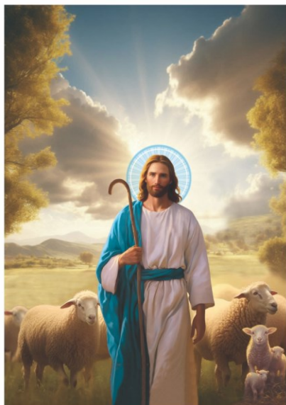
DOMINGO DO BOM PASTOR Dia Mundial de Oração pelas vocações